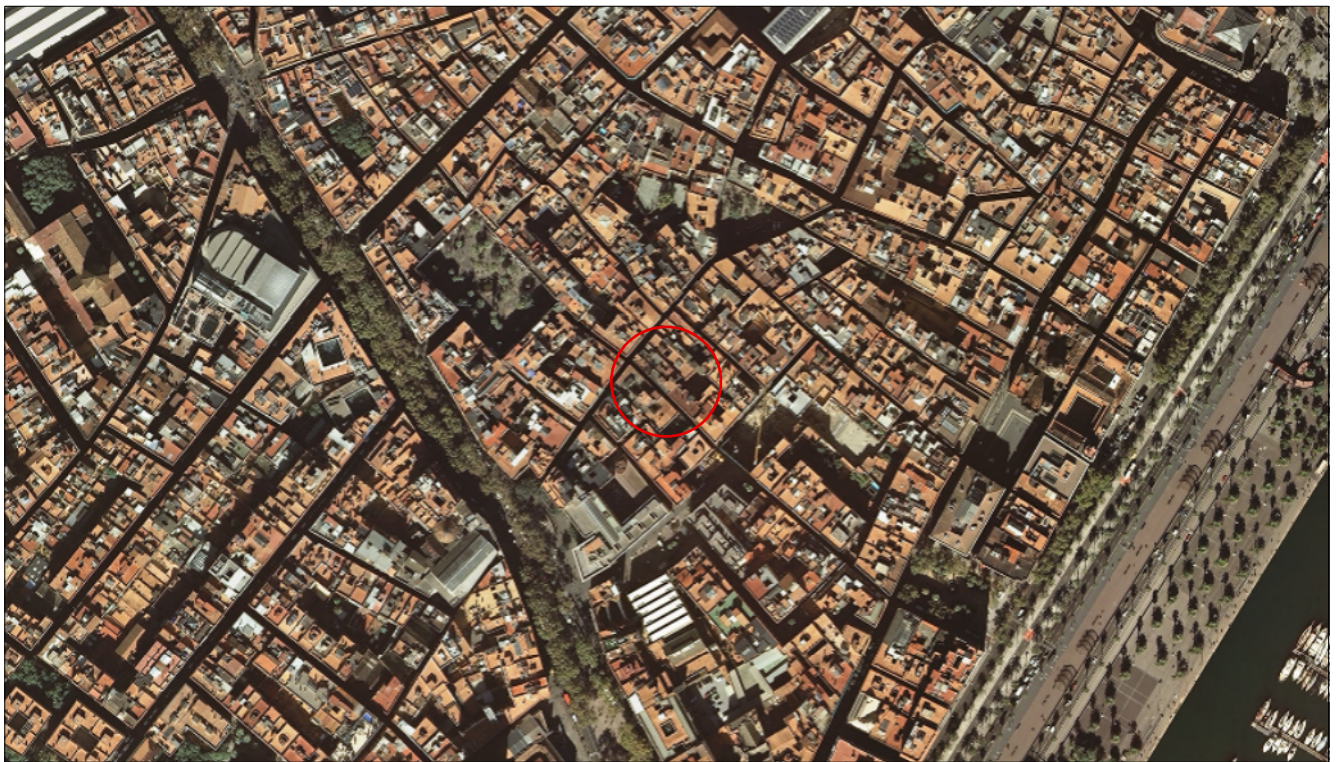
Ortofotomatge Escala 1:5.000