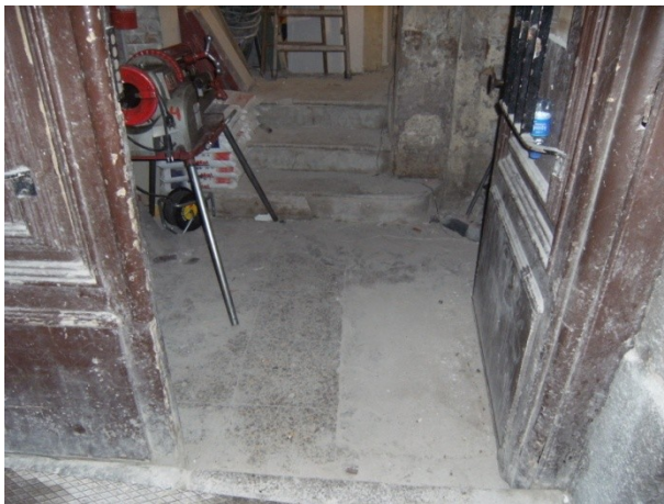
FOTO 3. Vestíbol de l'immoble abans de la intervenció