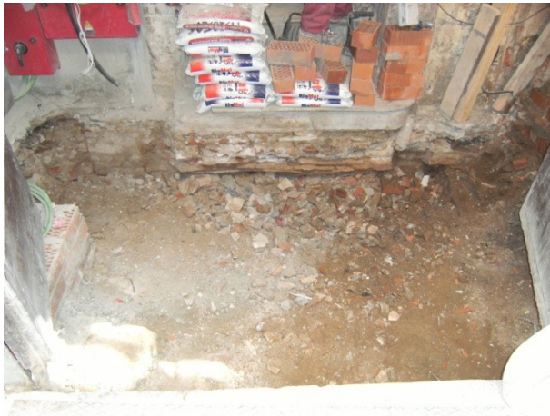
FOTO 7. Final de les tasques d'excavació. S'observa la runa que rebleix tot el pou mort