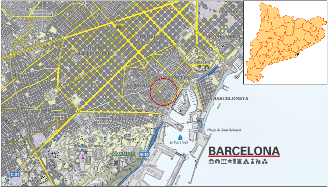
Mapa topogràfic Escala 1:50.000