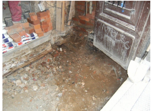
FOTO 8. Final de les tasques d'excavació. S'observa la runa que rebleix tot el pou mort