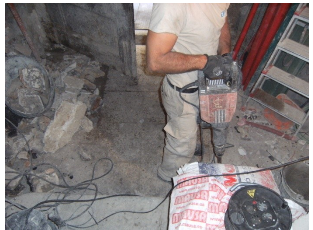
FOTO 4. Inicis de les tasques d'excavació