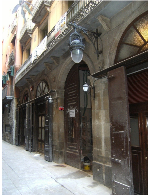
FOTO 2. Vista general del immoble