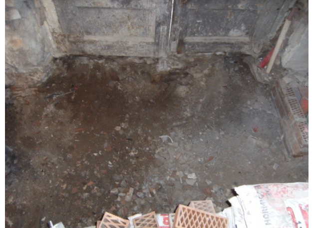
FOTO 10. Final de les tasques d'excavació. S'observa la runa que rebleix tot el pou mort