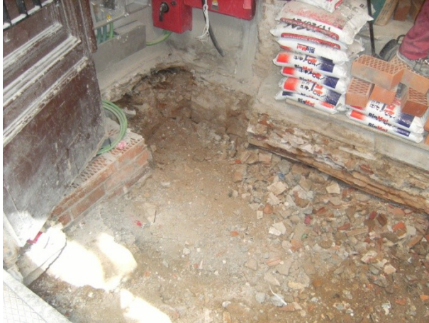
FOTO 9. Final de les tasques d'excavació. S'observa la runa que rebleix tot el pou mort