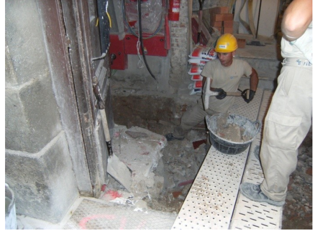
FOTO 6. Tasques d'excavació