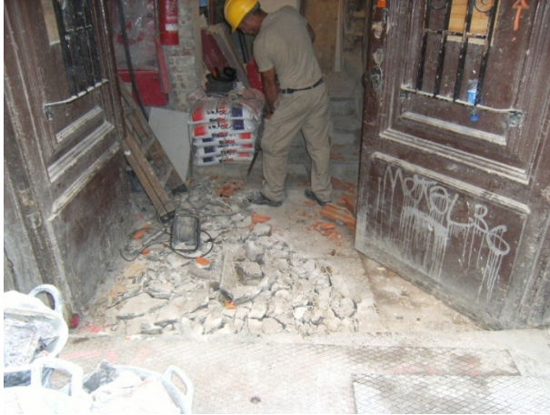
FOTO 5. Tasques d'excavació