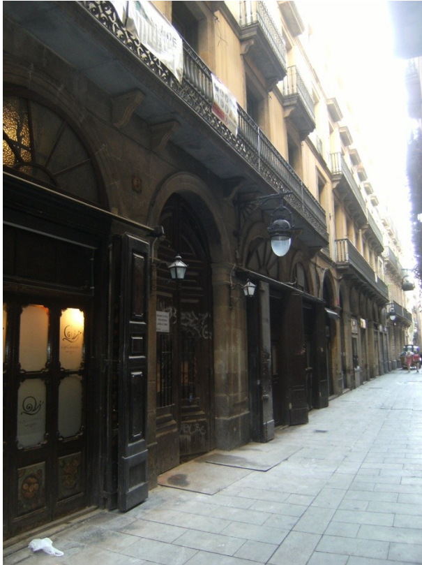
FOTO 1. Vista general del immoble